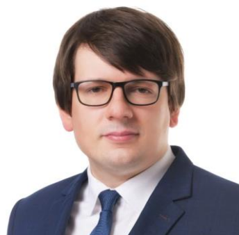
Michał Wilczak - Drugi Zastępca Burmistrza Namysłowa